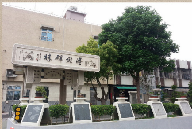
港墘碑林接近完工