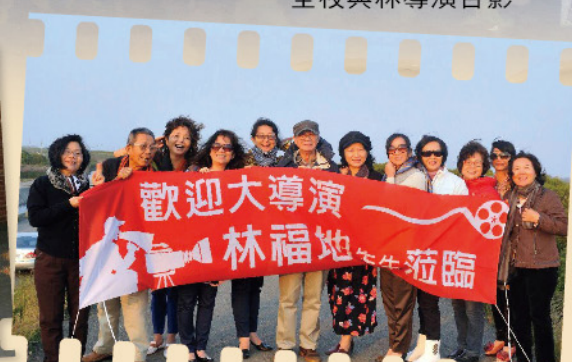
林導的粉司趕來歡迎