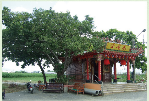
老朴樹與水尾公廟

水尾公由原先公尺高的小小廟，改建成如今頗具規模的小廟，顯現出村民對水尾公的敬愛與崇拜。古時候，村民經濟條件較差，水尾公廟又地處偏僻，水尾公廟從來沒有信徒以演戲來酬神，所以村民無錢還債時，每以「等水尾公作戲，我就還你！」話語來搪塞。如今交通便利、經濟富裕，水尾公廟年年演戲，車來車往的熱鬧景致與當年田埂小徑的荒涼情境，不可同日而語。