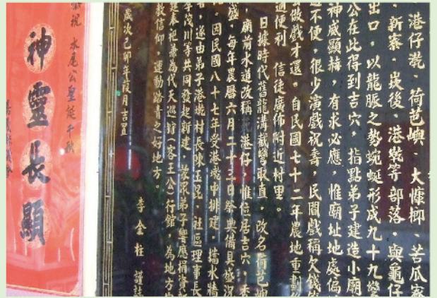
基於民俗·死港仔的「死」字硬被鑿除

從民俗、宗教、心理的角度而言，此舉雖然粗糙，勉強可以接受；但從文化、歷史、文物的角度而言，這是一種破壞的行為。如能以他物將「死」字蓋上，則文化得以受到尊重、歷史原貌得以傳承、文物得以完整保存，信徒的心理障礙亦可消除，達到面面兼顧的結果。此舉雖屬無心之插曲，不僅為水尾公廟添加一則文物故事，亦為鄉土教學及社區巡訪增一趣談。