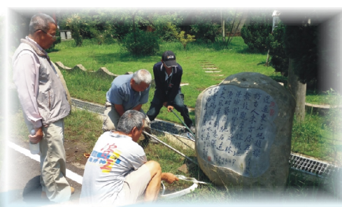
利用假日施工置放