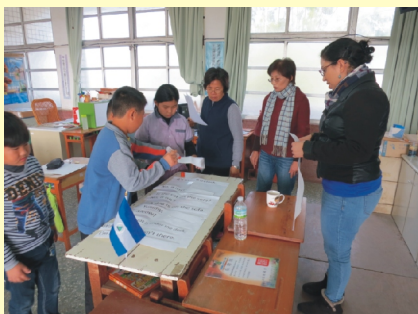
外籍老師協助英語闖關活動