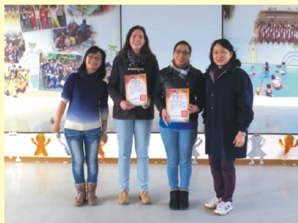
校長頒發感謝狀給兩位外籍教師