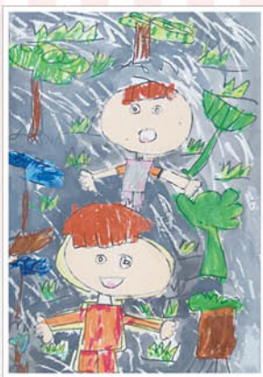
▲下雨天 - 李宗諺