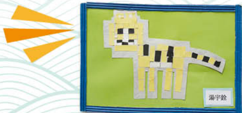
▲老虎拼貼 - 湯宇鈺