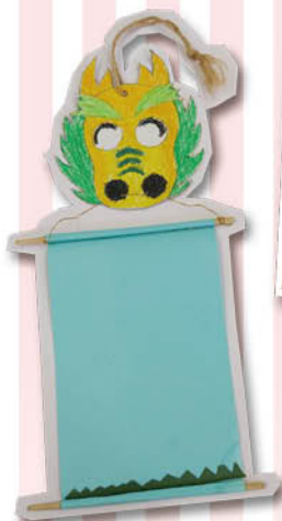
▲掛飾 - 劉文仁