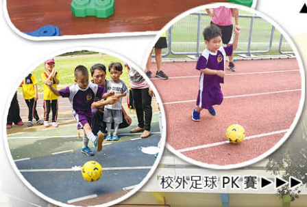
校外足球 PK 賽 ▶▶▶