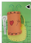
一甲 李秉珉 咖啡杯卡片