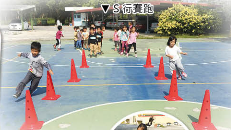
▼ S 行賽跑