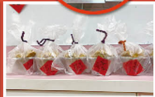
▼弄獅頭 + 鞭炮春聯